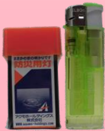
市販の 100 円ライターとの比較